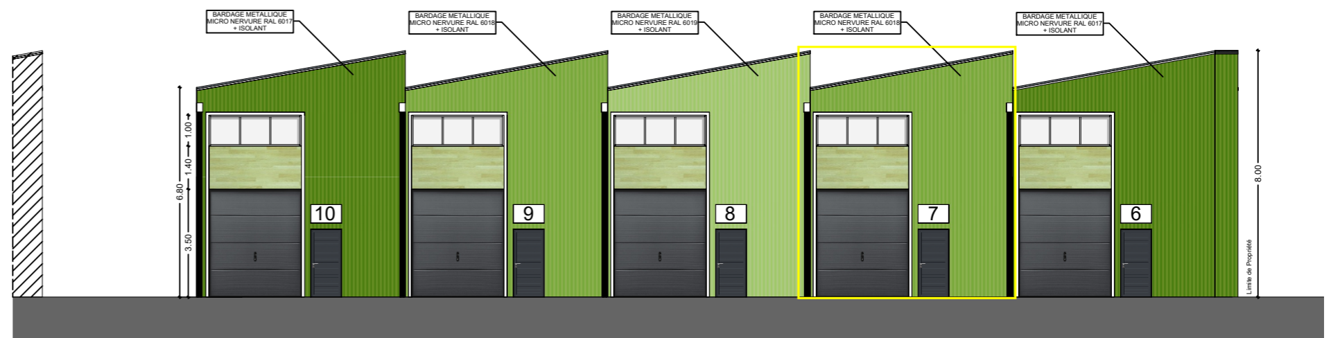
FACADE NORD 2-b