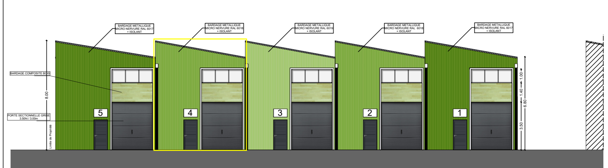
FACADE SUD - BAT 2-b