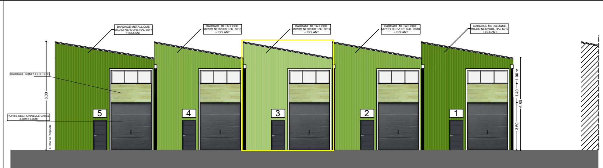
FACADE SUD - BAT 2-b