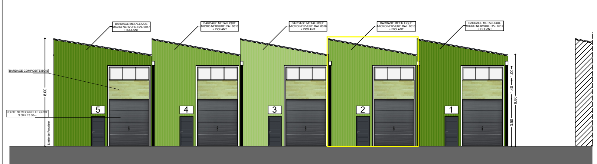
FACADE SUD - BAT 2-b