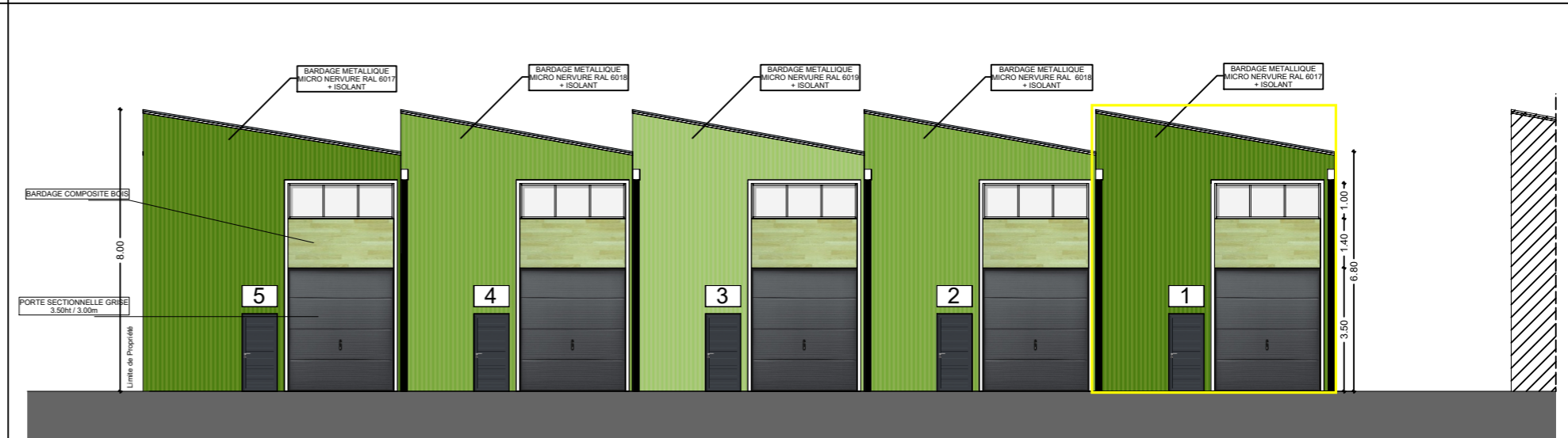
FACADE SUD - BAT 2-b