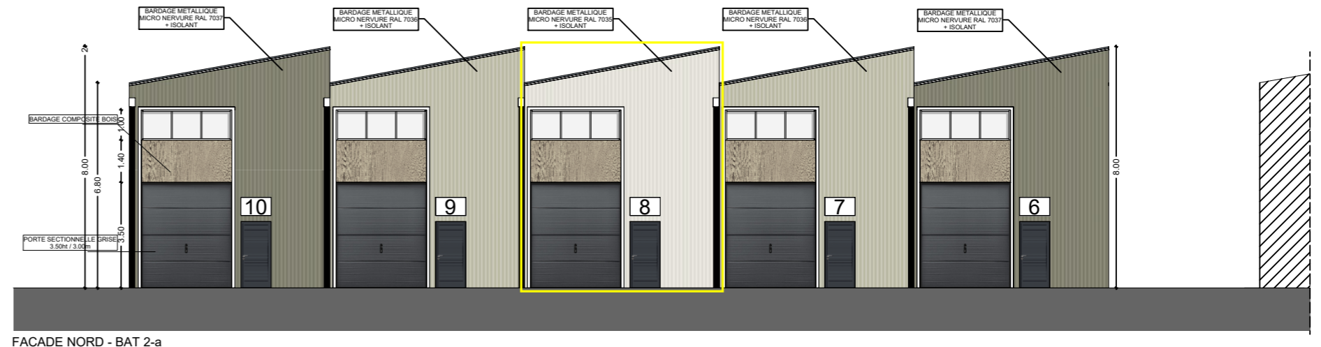
FACADE NORD - BAT 2-a