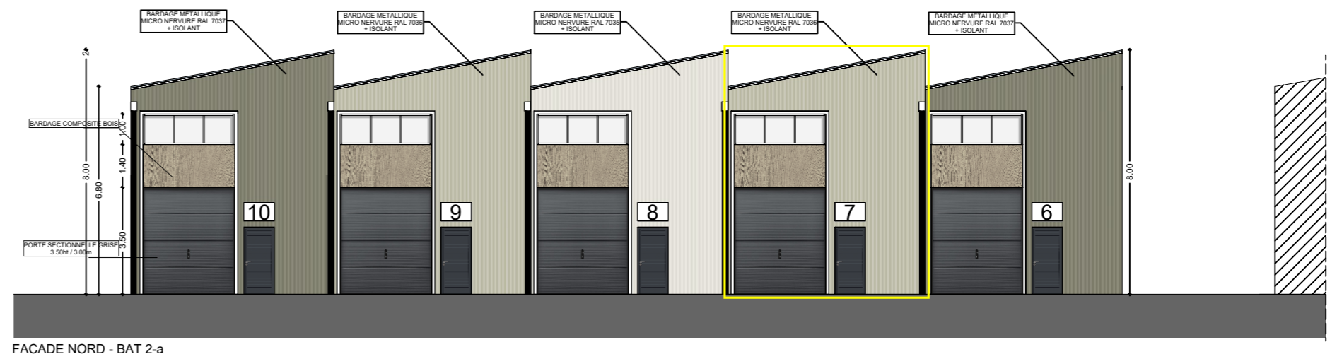
FACADE NORD - BAT 2-a