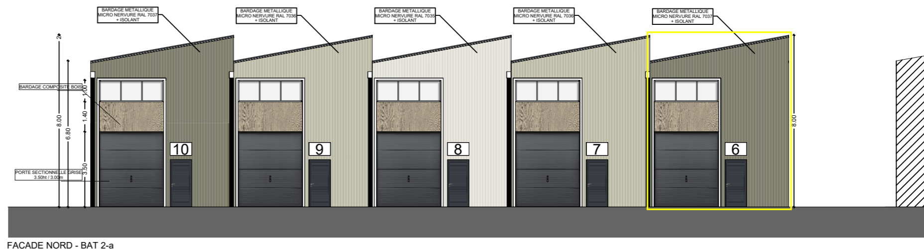
FACADE NORD - BAT 2-a