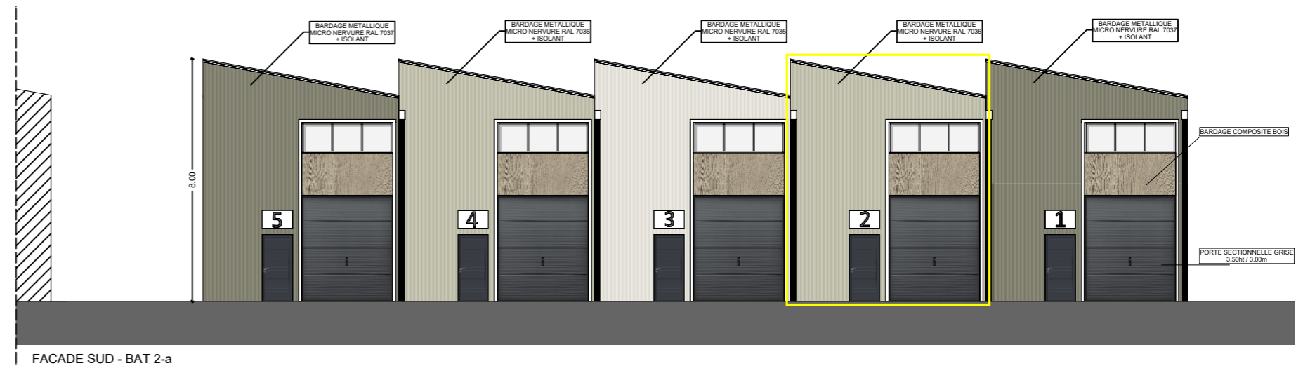
FACADE SUD - BAT 2-a