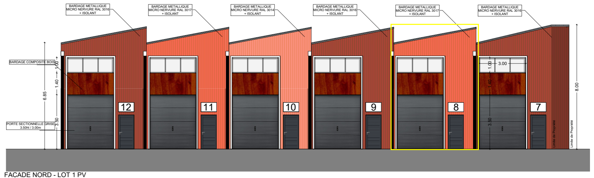
FACADE NORD - LOT 1 PV